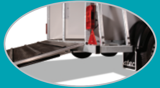
zeer lage instap