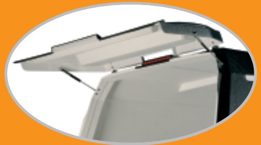
bovenklep en 3 e remlicht