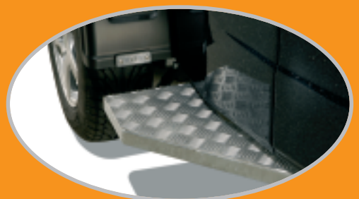
asbeschermering en geïntegreerde verlichting