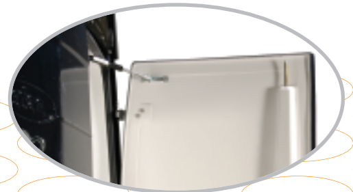
gasveer en driepuntsvergrendeling