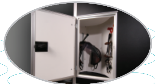
ruime zadelkamer (optie)