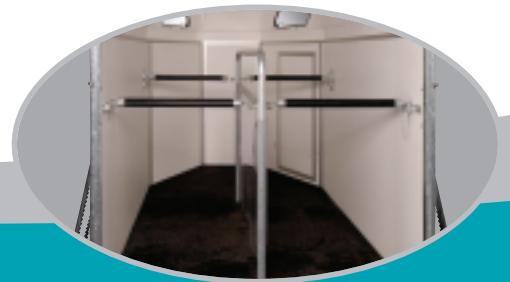
transparant tussenschot (2-paards)