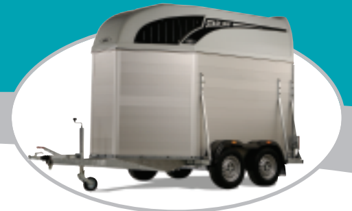
aluminium uitvoering (optie)