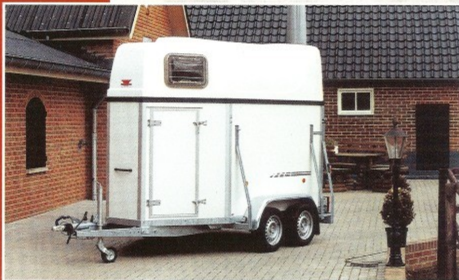
Fotolocatie: Manege Sueters-Hengelo (Gld)